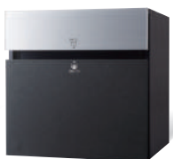
CTCR2153TB ※1 (パネル:铸铁ブラック) 価格 ¥109,800 (税別)