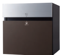
CTCR2153MA ※1 (パネル:エイジングブラウン) 価格 ¥109,800 (税別)