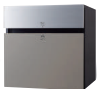
CTCR2153SC ※1 (パネル:ステンシルパー) 価格 ¥109,800 (税別)