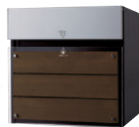
CTCR2154MB ※2 (パネル:ウッド、クリアガラス調) エボニーブラウン 価格 ¥120,500 (税別)

※1 玉吹き塗装ですので、一品一品色合いが異なります。(並べてご使用の場合はご注意ください。)