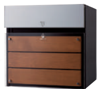
CTCR2154MD ※2 (パネル:ウッド、クリアガラス調) チークブラウン 価格 ¥120,500 (税別)