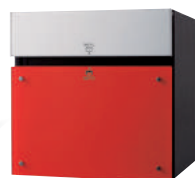
CTCR2153R (パネル:ビビットレッド) 価格 ¥120,500 (税別)