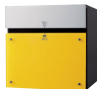
CTCR2153Y (パネル:ダンディライアン) 価格 ¥120,500 (税別)