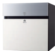
CTCR2153WS ※1 (パネル:漆喰ホワイト) 価格 ¥109,800 (税別)