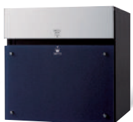
CTCR2153D (パネル:ネイビーブルー) 価格 ¥120,500 (税別)