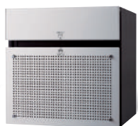
CTCR2151S (パネル:アルミパンチング) 価格 ¥120,500 (税別)