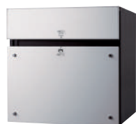
CTCR2150S (パネル:アルミヘアライン) 価格 ¥120,500 (税別)