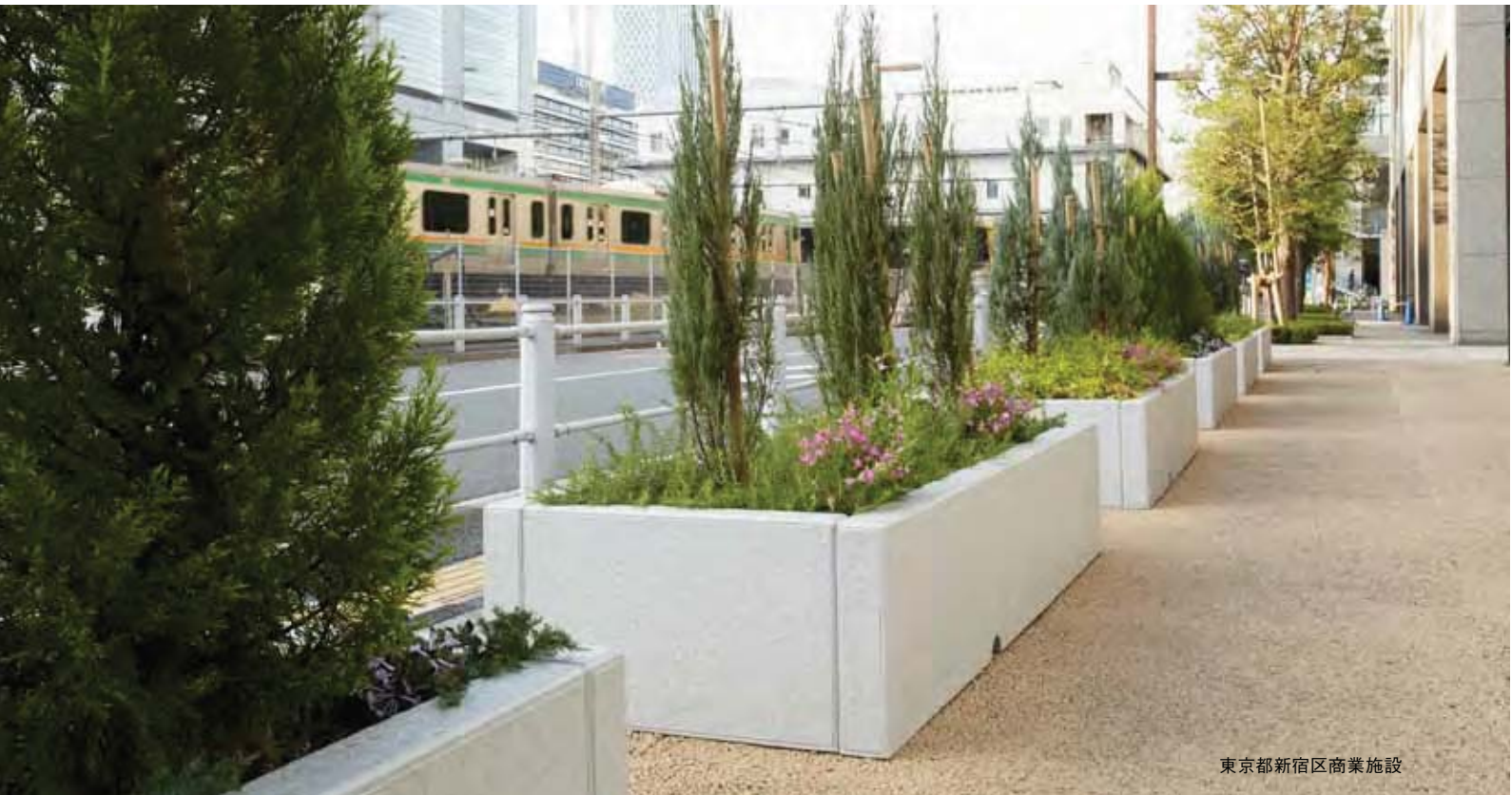
東京都新宿区商業施設