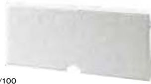
基本パネル (排水口付)