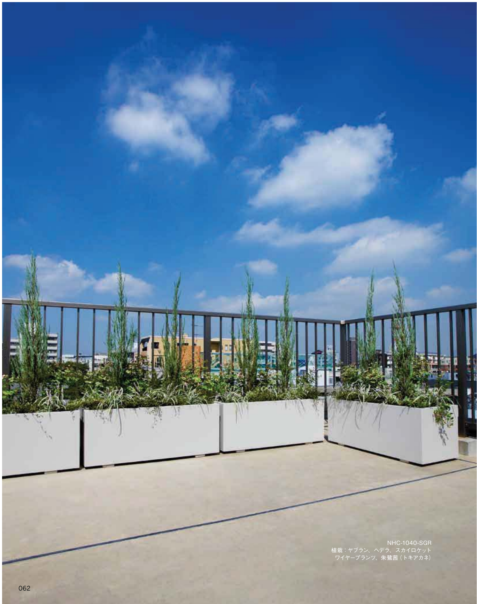
NHC-1040-SGR 植栽：ヤブラン、ヘデラ、スカイロケット ワイヤープランツ、朱鷺茜（トキアカネ）